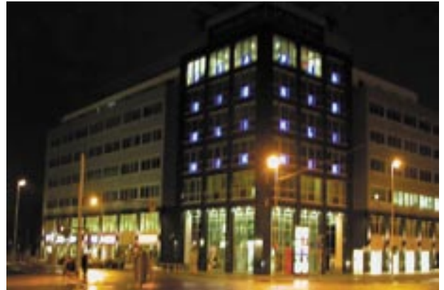
Praxisklinik am Johannisplatz

Die Nasenscheidewand bildet den zentralen Anteil des gesamten Nasengerüsts. Bei Fehlstellungen desselben sind praktisch immer auch äußere Abweichungen vorhanden. Die äußere Nasenachse ist nur mit einer Septumkorrektur zu begradigen, besonders im knorpeligen Teil. Eine anatomische Deformität der Nasenscheidewand ist