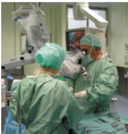
Funktionell-Ästhetische Nasenoperation mit OP-Mikroskop

Die Nasenkorrektur stellt einen der anspruchvollsten ästhetischen Eingriffe dar. Eine misslungene Nasenkorrektur lässt sich im Alltagsleben praktisch nicht verbergen und führt oft zu schweren psychischen Schäden bei den Patienten.